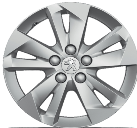
TARANAKI 15" Allure